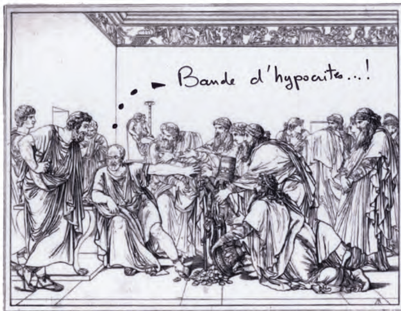
Hippocrate refusant les présents d'Artaxerxès

Ne nous soucions donc pas de notre PIB côté dépenses de santé, nous resterons dans le top 10 des pays les plus riches du monde... Jugez donc : nous avons une belle grande médecine moderne que l'on nous dit des plus performantes, que l'on nous envierait, allant de triomphe en triomphe, mais... nous sommes de plus en plus malades, dopés aux antidépresseurs, anxiolytiques, psychotropes, anti-migraineux, hypertenseurs, antibiotiques, tués par les maladies nosocomiales, intoxiqués aux médicaments (le rapport Queneau* évalue de 4 à 15% les hospitalisations imputables à une pathologie iatrogène, et les décès